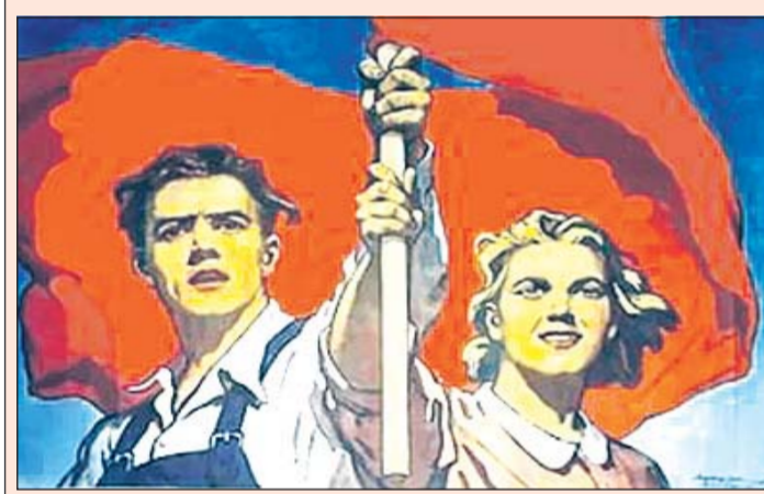
На прошедшем Пленуме ЦК ЛКСМ РФ был рассмотрен вопрос о взаимодействии Ленинского комсомола и независимых студенческих профсоюзов, принято обращение к молодёжи России с просьбой о поддержке КПРФ на предстоящих выборах.

В преддверии выборов в Государственную Думу ЦК ЛКСМ РФ принял обращение к молодёжи России с просьбой поддержать на предстоящих выборах КПРФ.