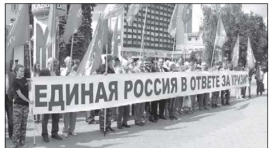
соковых сокращений и переходов на неполное рабочее время. В итоге Курскую область внесли на карту социально-экономических горячих точек России.