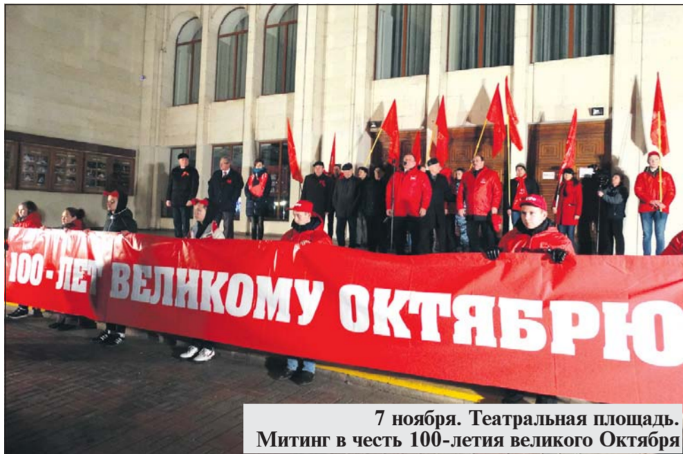
7 ноября. Театральная площадь. Митинг в честь 100-летия великого Октября