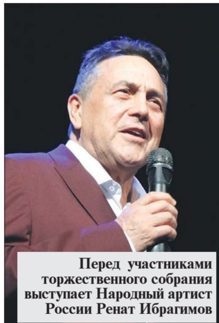
Перед участниками торжественного собрания выступает Народный артист России Ренат Ибрагимов