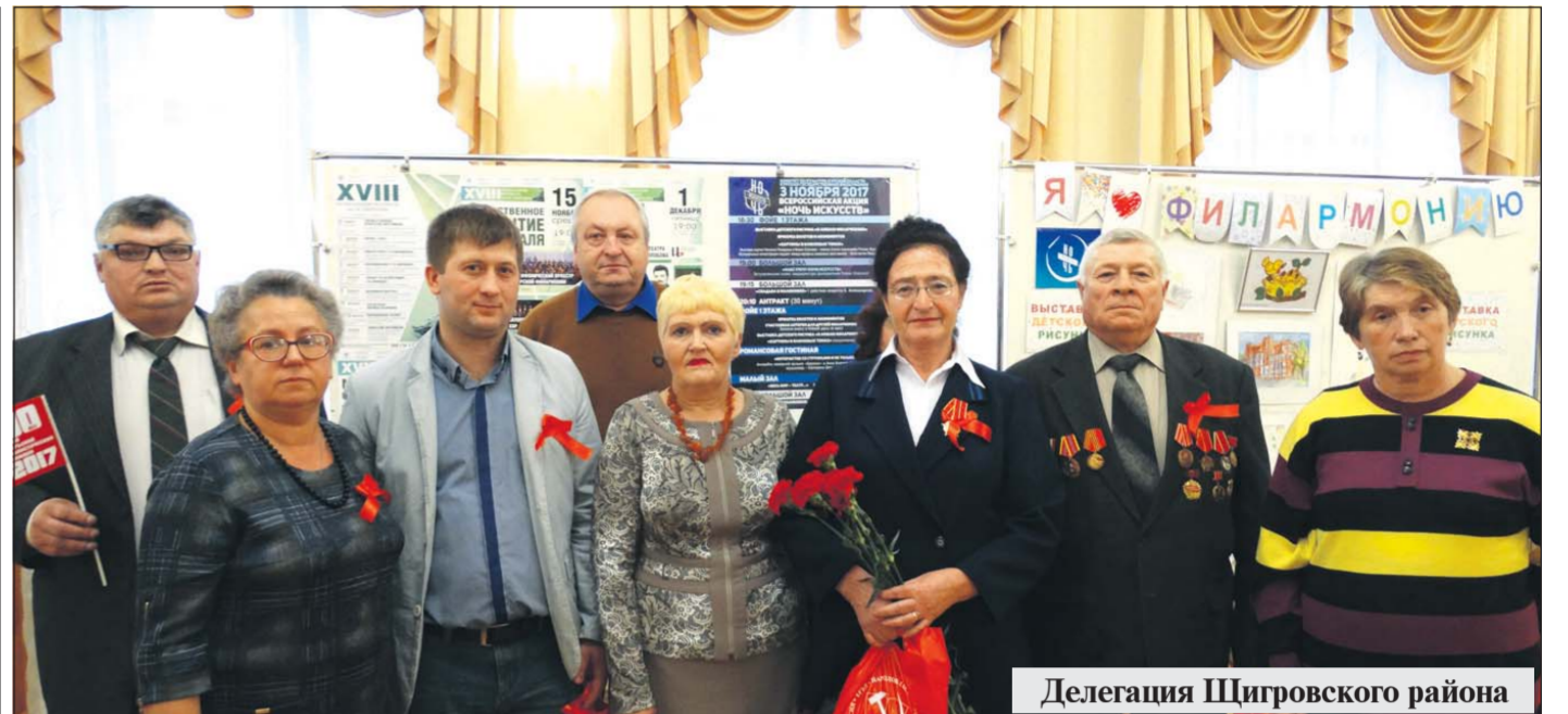
Делегация Шигровского района