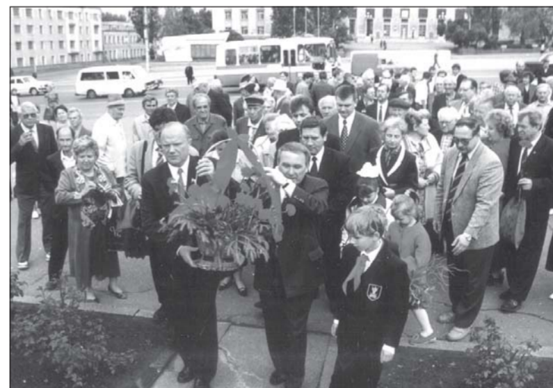
Г.А. Зюганов в Курске 1999 г.