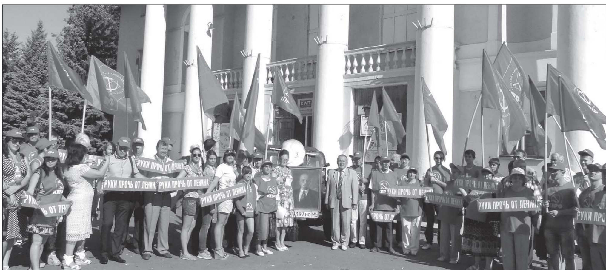
20 июля 2013 г. в Щиграх состоялась акция протеста против сноса памятника В.И. Ленину. Ее инициатором стал местный райком КПРФ. На митинг поддержать щигровцев приехали курские коммунисты.