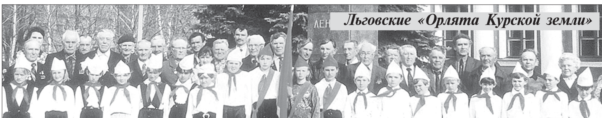
Львовские «Орлята Курской земли»

* Два события в отечественной истории мы всегда называем Великими - это Великая Октябрьская социалистическая революция и Великая Отечественная война. Значимость этих событий со временем осознаётся всё в большей степени.