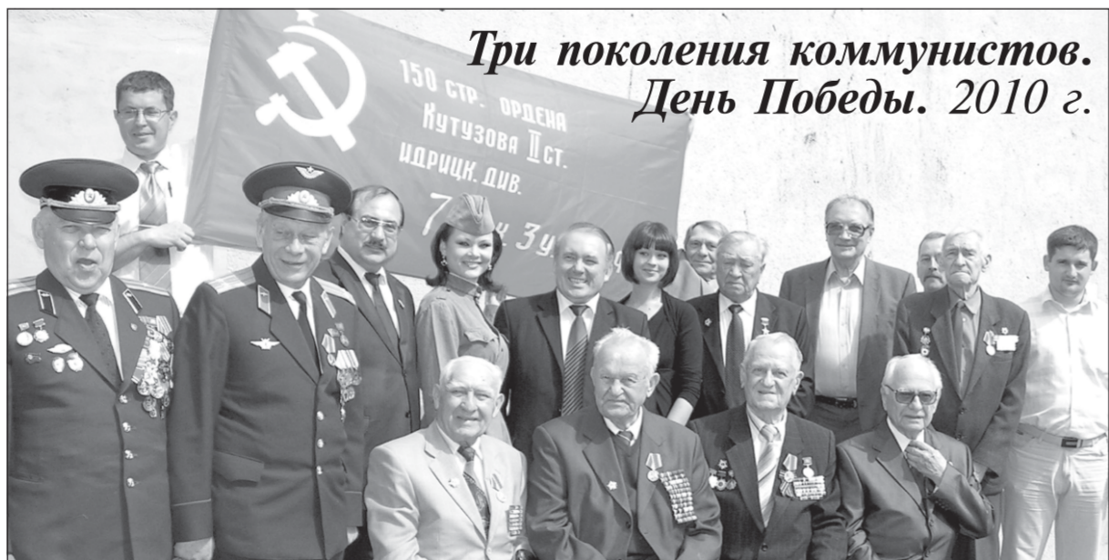
Три поколения коммунистов. День Победы. 2010 г.