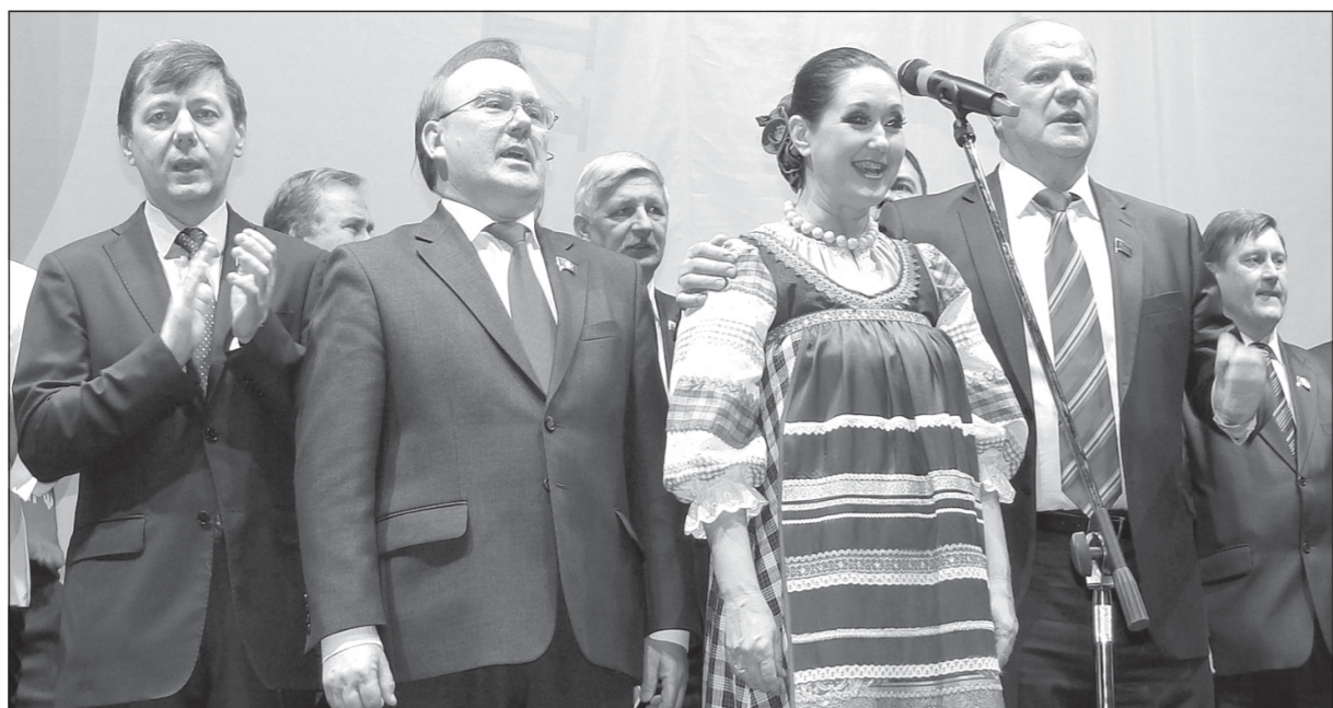
«РУССКИЙ СТАРТ» Г.А. Зюганова в Орловской области 2012 г. Курская делегация в Орле