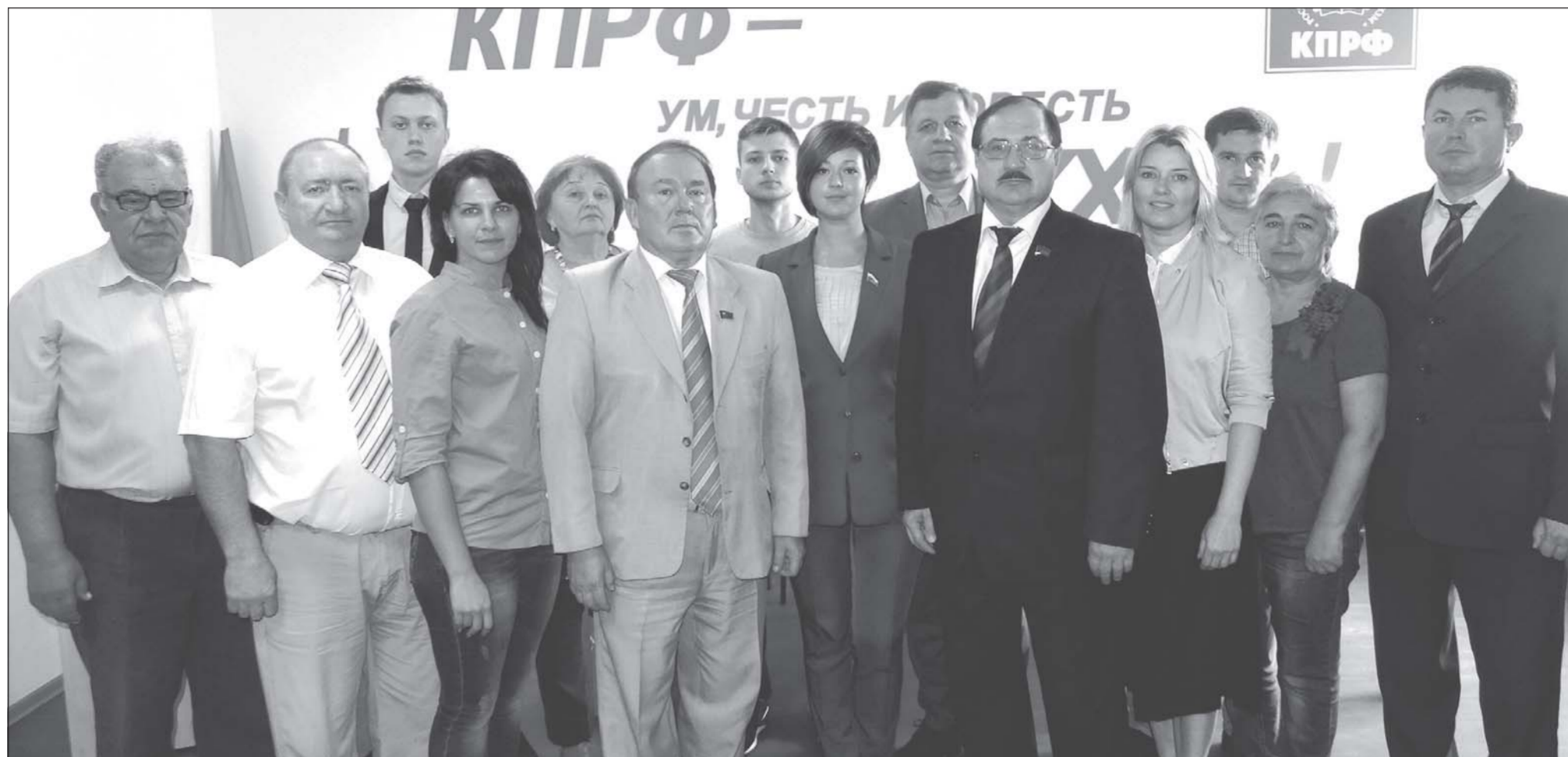
Команда КПРФ на выборах в областную Думу 2016 г.