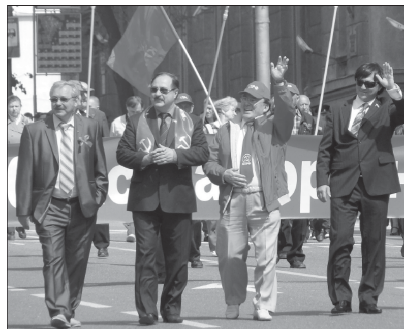
В авангарде Первомайской демонстрации курян