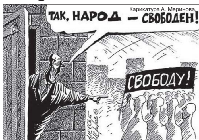
Карикатура А. Меринова.

Существовал закон о референдуме. На основании этого закона и проводилось голосование. В нём было четко записано, что результаты референдума имеют силу