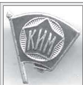
Комсомольский значок поменял три варианта дизайна. Самый первый - с аббревиатурой КИМ - Коммунистический интернационал молодежи. В 1945 году надпись сменилась на аббревиатуру ВЛКСМ. В 1958 году появился окончательный вариант дизайна - с изображением Ленина