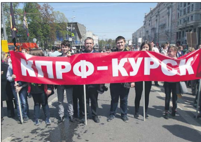
9 мая в Москве, в день Великой Победы советского народа над фашизмом, в традиционном праздничном шествии курскую делегацию представляла юная смена - комсомольцы и пионеры-красногалстучники отряда им. Олега Кошевого.