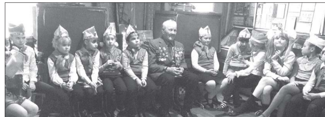
Окончание. Начало - на 1-й стр.

вечающая интересам народных масс, интересам государственной безопасности. Стране нужна перспективная, точно выверенная программа развития. Только ее воплощение в жизнь позволит консолидировать патриотические силы вокруг задач возрождения Родины.