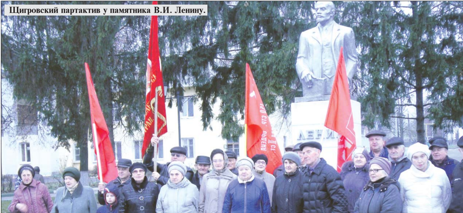
Щигровский партактив у памятника В.И. Ленину.