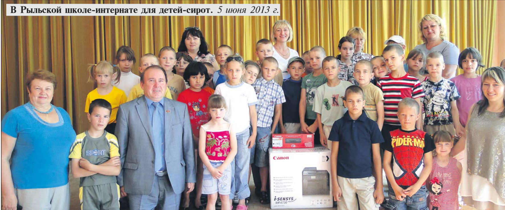
В Рыльской школе-интернате для детей-сирот. 5 июня 2013 г.