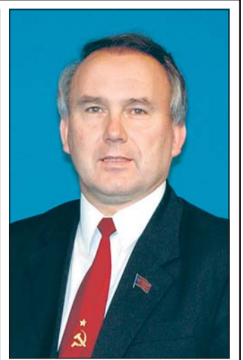
Председателем ЦК КПРФ вновь избран 1-й секретарь Курского ОК КПРФ, депутат Госдумы ФС РФ Н.Н. Иванов.