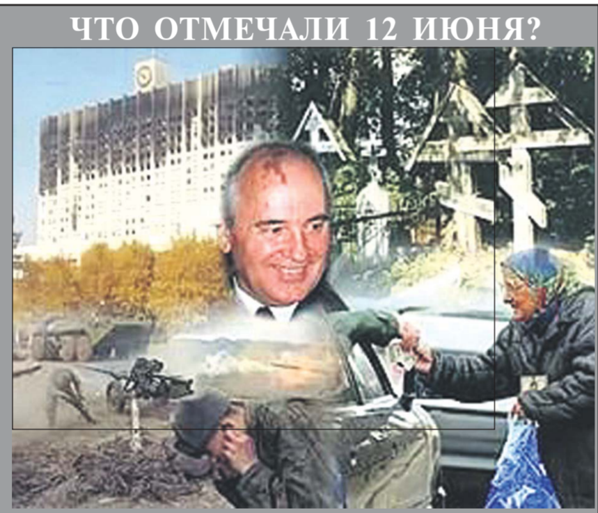
ЧТО ОТМЕЧАЛИ 12 ИЮНЯ?

Подготовлено по материалам интернет-сайтов.