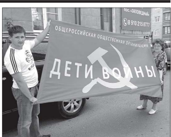
бирает воспоминания детей войны для публикации в СМИ. В планах — выпуск брошюр с воспоминаниями непосредственных участников тех страшных событий. Также ООО «Дети войны» организует поездки по местам боевой славы, музеем Солдовинского края, добивается льгот на посещение бассейна, бесплатных профосмотров и др.

В городах и селах Курской области: - проводятся акции и собираются подписи в поддержку принятия закона «О детях войны», обращения, письма детей войны по этой проблеме направляются в органы государственной власти и местного самоуправления, в региональные общественные палаты и т.д. Самостоятельно, либо в тесном контакте с советами ветеранов проводится патриотическая работа со школьниками и молодежью, еженедельные встречи детей войны в библиотеках, музеях боевой славы (Поньри, Прохоровка). ООО «Дети войны» со-