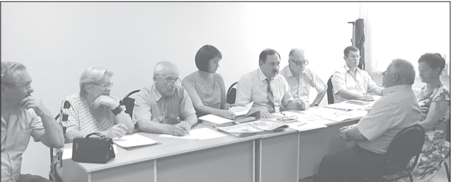
25 районах и округах.

Кроме компартии России и наших союзников поставить ребром этот вопрос никому. Мы будем на этом настаивать — жестко, последо-