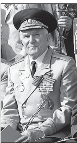
С 1991-1993 гг. - заместитель генерального директора по коммерческим вопросам ОАО «Спологи» (Архангельск).