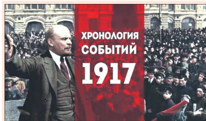
ХРОНОЛОГИЯ СОБЫТИЙ 1917

События 11 июля (24 июля) 1917 года Временное правительство постановило закрыть границы России для всех иностранных и русских подданных, кроме дипломатических курьеров. Временное правительство постановило предоставить право Государственному банку на вы-