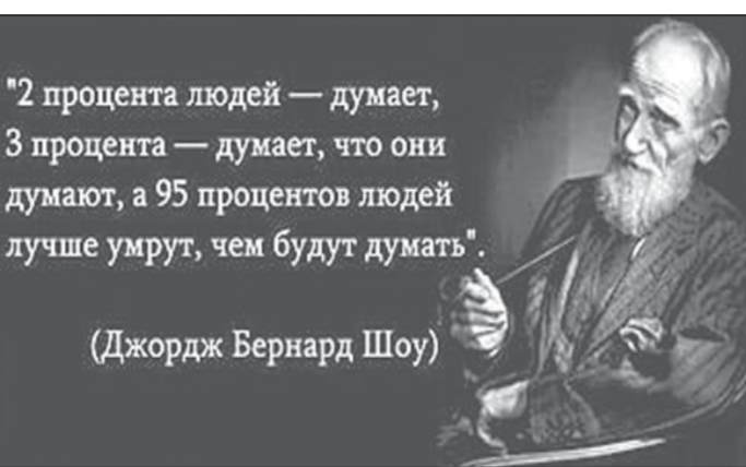
2 процента людей — думает, 3 процента — думает, что они думают, а 95 процентов людей лучше умрут, чем будут думать. (Джордж Бернард Шоу)

8. Александровский телевизионный завод. Здесь был выпущен первый советский