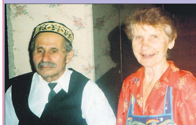
Тело в дело