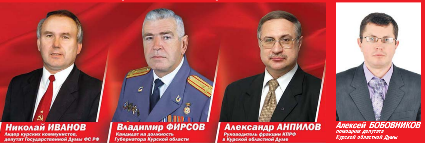
ИВАНОВ Николай Николаевич , 1957 года рождения, русский, депутат Государственной Думы ФС РФ 6 созыва (2011 - н. вр.), председатель ЦК РК КПРФ, 1-й секретарь Курского обкома КПРФ, окончил 4 высших учебных заведения, кандидат педагогических наук.

Кандидаты для избрания в Совет Федерации Федерального Собрания РФ от КПРФ