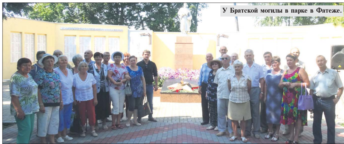
У Братской могилы в парке в Фатеже.

В начале июля 1943 года батарея капитана Игнешева, входившая в состав 3-й истребительно-противотанковой артиллерийской бригады, занимала оборону в районе села Самодуровка Поньковского района Курской области и готовилась к предстоящим боям. 5 июля 1943 года фашистские войска перешли в наступление. На направлении главного удара на посёлок Ольховатку они сосредоточили до 500 танков, в боевых порядках которых на бронетранспортерах следовала пехота. В воздухе пронеслись сотни фашистских самолётов. Но на этом направлении 2 советские дивизии совместно с артиллеристами и 2-й танковой армией дали мощный отпор врагу. Тогда 6 июля фашисты изменили направление удара и бросили свои силы в направлении села Самодуровка (теперь это село Игнешево - в честь Героя Советского Союза) в сток 13-й и 70-й армий Центрального фронта, где оборонялись лишь артиллеристы 3-й истребительно-противотанковой бригады полковника В.Н. Рукосуева и полк одной из стрелковых дивизий. 1-я батарея 3-й артиллерийской бригады под командованием капитана Игнешева приняла танковый таран на себя. Три дня ожесточённой боя почти не прекращалась. До 200 танков шли на позиции артиллеристов, которые стояли насмерть. 2-я и 7-я батареи артиллерийской бригады полностью погибли, но не отступили. На батарее Игнешева в отдельных атаках приходилось по 30-50 фашистских танков. За эти 3 дня батарея Игнешева отбила все атаки противника,