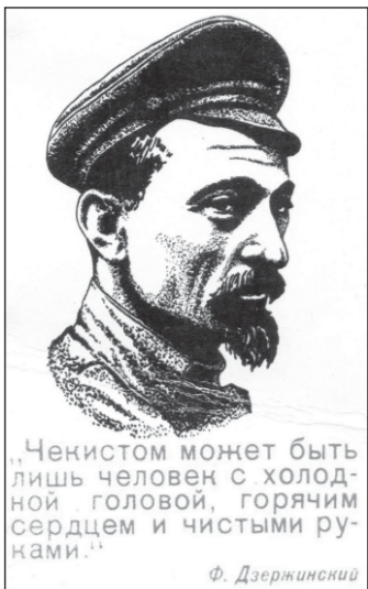
Чекистом монет быть лишь человек с холодной головой, горячим сердцем и чистыми руками.