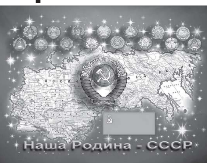
Наша Родина - СССР

На самом деле все это великолепный банкет оплачивали русский крестьянин, рабочий и инженер. Каждый из 147 миллионов жителей РСФСР фактически отдавал ежегодно 6 тысяч долларов, чтобы покрыть разницу между производством и потреблением жителей других республик. Поскольку русских было много, хватало на всех, хотя для по-настоящему