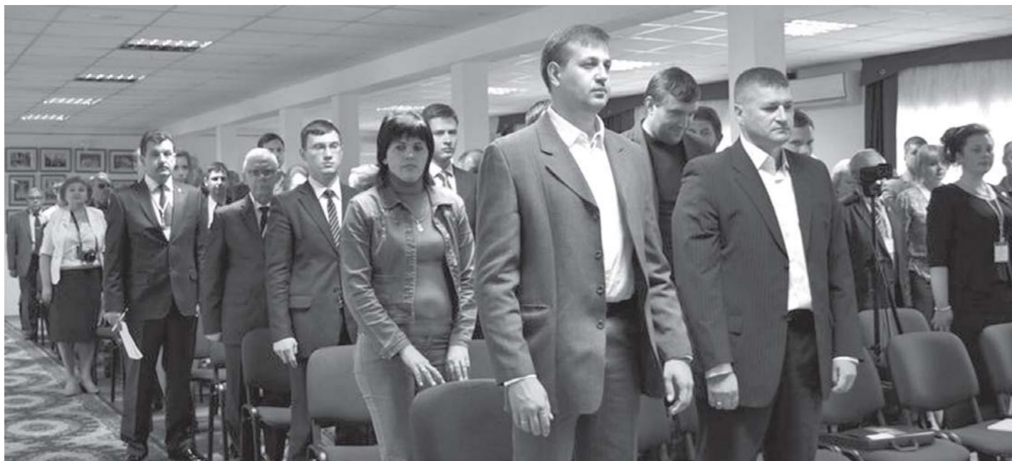
Продолжение. Начало на 1-й стр.

О политической ситуации в России и основных задачах региональных отделений КПКРФ С основным докладом «О политической ситуации в России и основных задачах региональных отделений КПКРФ» выступил член Президиума, секретарь ЦК КПКРФ Ю. В. Афонин. Он детально проанализировал социально-экономическое и политическое состояние страны и общества, которое непосредственно касается содержания, основных направлений и характера работы Компартии. Передав тёплые слова приветствия от Председателя Коммунистической партии Геннадия Андреевича Зюганова, которого ждали на курской земле, Юрий Вячеславович отметил, что именно в этот день в стране проходит Государственный Совет по вопросам развития отечественной промышленности, малого бизнеса. В этом мероприятии принимает участие Геннадий Андреевич Зюганов, поэтому он не смог приехать к курским коммунистам. На следующей неделе планируется поездка лидера КПКРФ в Китай для встречи с руководством этой