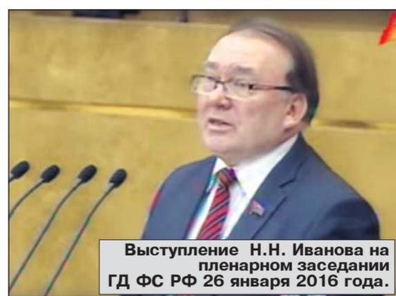
Выступление Н.Н. Иванова на пленарном заседании ГД ФС РФ 26 января 2016 года.

Что касается МРОТ, то он вообще не имеет каких-либо разумных обоснований, так как устанавливается правительством значительно ниже прожиточного минимума. При этом соотношение МРОТ к прожиточному минимуму год от года ухудшается. В 2009 году МРОТ составлял 77,7% прожиточного минимума трудоспособного человека, в 2014 был доведен правительством до 64%, в 2015 году — до 58,7%. Подчеркну: это официальные данные. Иначе говоря, действующая власть официально признаёт, что из года в год в стране нарастает обнищание трудящихся. Причём обнищание даже не относительное, а абсолютное.