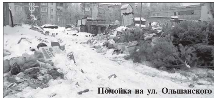
Помойка на ул. Ольшанского