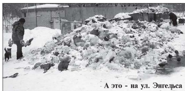
А это - на ул. Энгельса