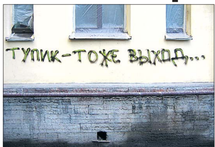
Следствие бездарного курса непотопляемой чубайсовско-гайдаровской команды.

На самом деле, источник нынешних бед и будущих потрясений — внутри страны. Независимые экономисты уже криком кричат, что кризис в стране — прямое