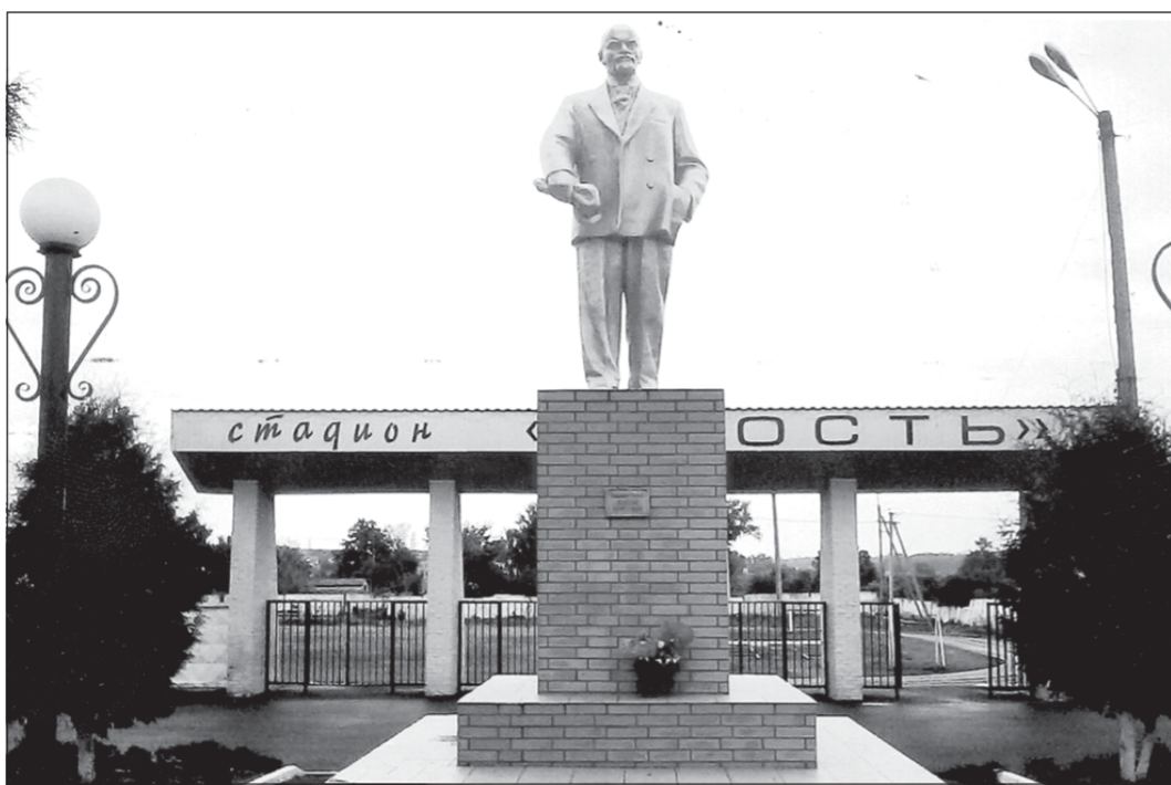
Мы желаем всем райкомом КПРФ привести в порядок памятники В.И. Ленину и братские могилы, где лежат те, кто защищал нашу Родину.