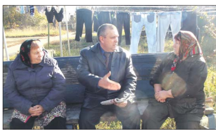
Жители посёлка Юбилейный собрались на пикет.

го порядка, либо у нас есть шанс вместе с коммунистами выйти из капиталистического тупика за счёт национализации всех природных богатств, которые захватили нувориши и за счёт создания Правительства Народного доверия, сегодня правительство власть имущих во главе с Д.А. Медведевым является гарантиями олигархического капитализма и незаконно нажитых богатств путем ограбления всего российского народа: приватизации, коррупции, антинародных законов. Принятие инициатив фракции КПРФ в Госдуме о ведении прогрессивной шкалы налогообложения, налог на роскошь и сверхприбыль пока все еще разбиваются о парламентское боль-