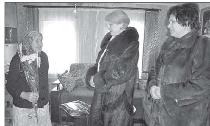
ростом тарифов ЖКХ. А ведь и любой рейтинг, в котором пытаются сравнить комфорт жизни пенсионеров в разных странах, включает в себя не только размер пенсии, но и государственные траты на здравоохранение, ВВП на душу населения, равномерность распределения доходов среди населения и многое другое.

коммунальные услуги и обеспечивать себя минимальным стандартом питания и лекарствами, но и вести полноценный образ жизни. Средний размер пенсии должен быть не ниже 50% размера средней заработной платы по стране. Это минимальная планка. Третье: понятность пенсионных правил. Двумя ключевыми критериями должны быть трудовой стаж и уровень заработной платы гражданина, с которой уплачиваются взносы. Такая система расчета оправдала себя в советское время, является проверенной, ясной и предсказуемой. В то же время система пенсионного обеспечения требует неотложных реанимационных мер. Для этого мы разработали «программу-минимум» — «12 антикризисных шагов». Они отвечают на вопрос, что мы сделаем в Государственной Думе прямо завтра в конкретных нынешних условиях для спасения пенсионной системы. Вот некоторые из них: - пенсионерам будут возвращены все долги по индексации пенсий за