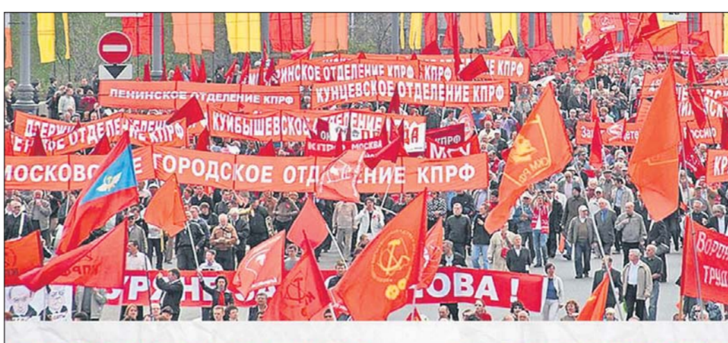
ПРАВИТЕЛЬСТВО - В ОТСТАВКУ!

квартире, потому что айфоном гвоздь не забьешь. Считаю, что премьер вместе со всем составом правительства должен немедленно подать в отставку. Только этим можно сделать хоть какое-то доброе дело в отношении народа. За последние месяцы и годы ни одного закона не было предложено для народа.