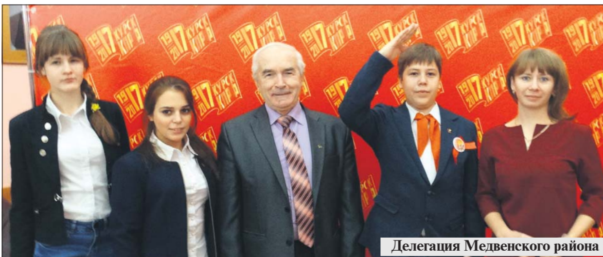
Делегация Медвенского района