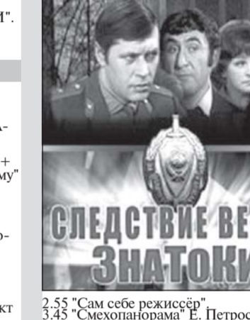
2.55 "Сам себе режиссер" 3.45 "Смешарки" Е. Петросяна.

5.00 "СРОЧНО В НОМЕР-2". (12+). 6.45 "Сам себе режиссер" 8.15 "Утренняя почта" 8.45 "Местное время. Вести-Москва. Неделя в городе." 10.10 "Сто к одному". Телигра. 10.10 "Кот в шляпе с Г. Кизяковым". 11.00 Вести. 11.30 Премьера. "Судья разрешается". 11.30 "ПОД АДНАЙ" (12+). 17.00 Премьера. Кастинг Всероссийского открытого телевизионного конкурса талантов "Синия птица" 17.30 Премьера. Всероссийский открытый телевизионный конкурс юных талантов "Синия птица" 20.00 Вести. Местное время. 22.00 "Воскресный вечер с Владимиром Соловьевым" (12+). 0.00 "Дежурный по стране". Михаил Жванецкий. 1.00 "СЛЕДСТВИЕ ВЕДУТ ЗНАТОКИ". (12+). 0.55 "КРУЖЕВА". (12+). 3.00 "СЛЕДСТВИЕ ВЕДУТ ЗНАТОКИ".