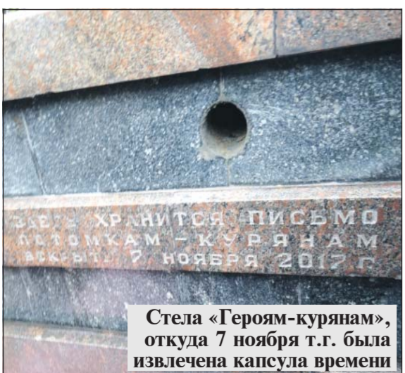
Стела «Героям-курянам», откуда 7 ноября т.г. была извлечена капсула времени

Сохраняется и такой вариант, как подписка через секретарей партийных организаций и редакцию. На 1 месяц подписка на нашу газету по-прежнему стоит 20 рублей, на полугодие - 120 рублей.