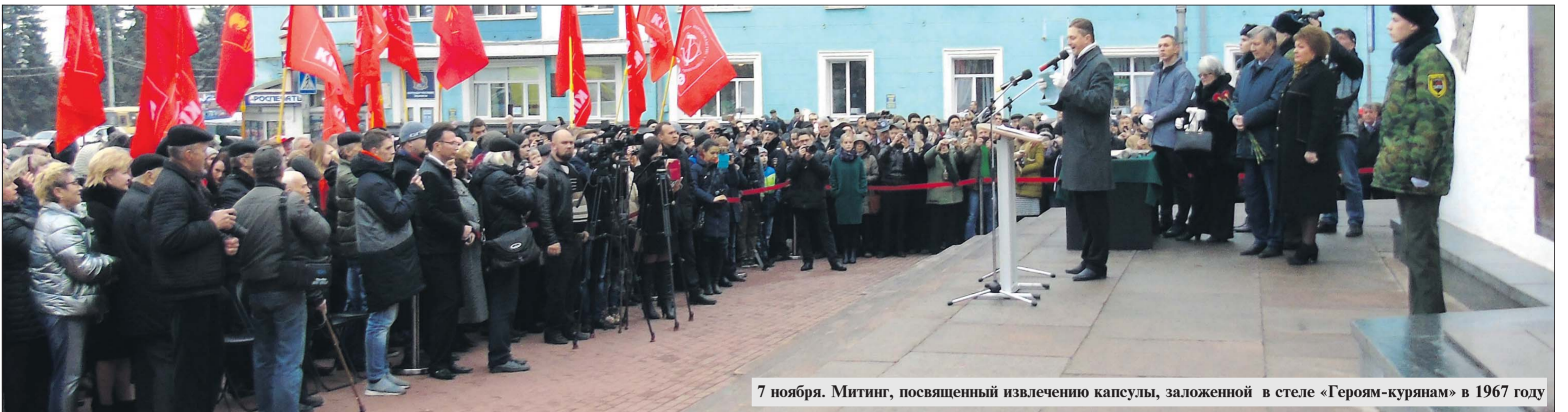
7 ноября. Митинг, посвященный извлечению капсулы, заложенной в стеле «Героям-курянам» в 1967 году