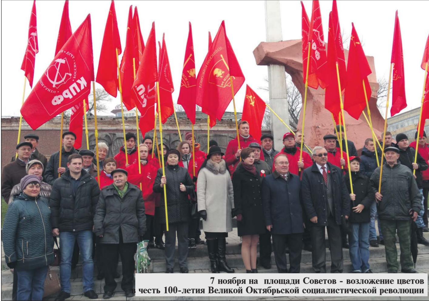
7 ноября на площади Советов - возложение цветов честь 100-летия Великой Октябрьской социалистической революции