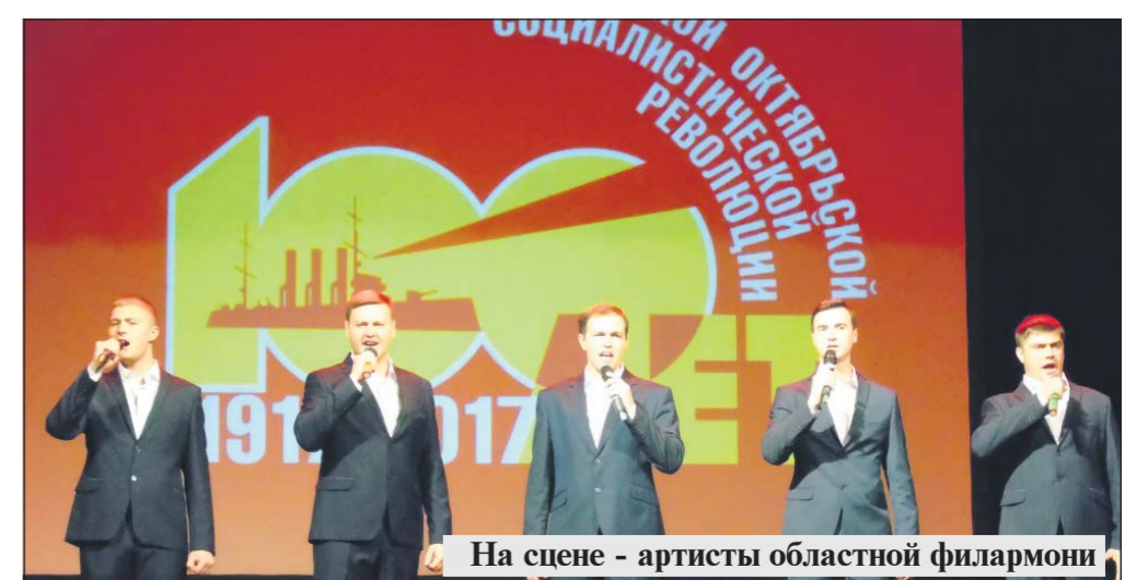
На сцене - артисты областной филармонии