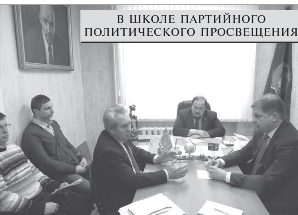
В ШКОЛЕ ПАРТИЙНОГО ПОЛИТИЧЕСКОГО ПРОСВЕЩЕНИЯ

Российский рабочий класс нуждается в Коммунистической партии прежде всего для осознания своих коренных интересов и чёткого определения стратегических целей. Повседневные интересы побуждают пролетариев к стихийной экономической борьбе. Но такая борьба способствует решению только сиюминутных задач. Ещё в 1900 году В.И. Ленин замечал, что в чисто экономической борьбе нет ничего социалистического: «Для социалиста экономическая борьба служит базисом для организации рабочих в революционную партию, для сплочения и развития их классовой борьбы против всего капиталистического строя».