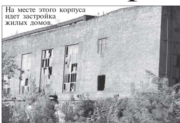
На месте этого корпуса идет застройка жилых домов.

В микрорайоне Волокно будет построен мусороперерабатывающий завод. Найти для него место в городе было достаточно проблематично, так как подобный объект должен находиться на значительном расстоянии от жилых домов, садоводческих то-