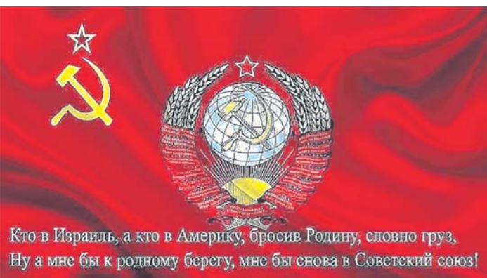
Кто в Израиль, а кто в Америку, бросив Родину, словно груз, Ну а мне бы к родному берегу, мне бы снова в Советский союз!