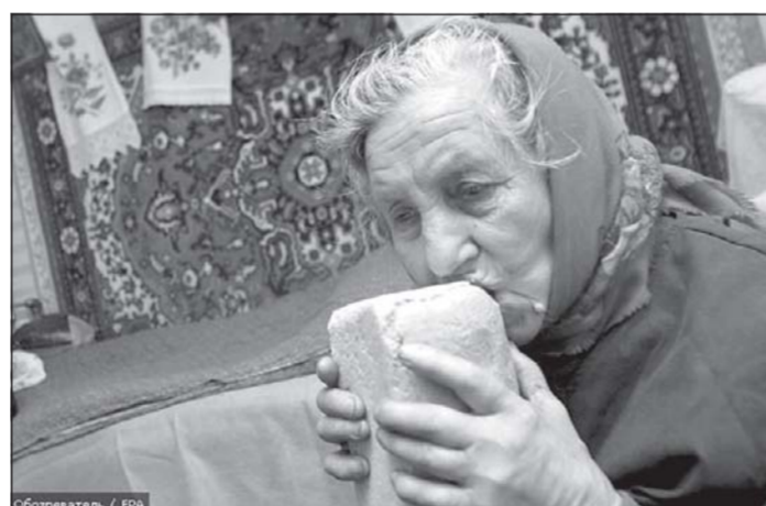
Соборовская / 69%

Иными словами, я смоделировала своих персонажей по двум стереотипным представлениям о пожилых людях: «дряхлый, подавленный пенсионер и вечно молодой чудак. Один авторитетный для меня автор после прочтения черновика варианта спросил: «А что еще можно о них сказать кроме того, что они старики?» Это сильно меня расстроило, я ушла в себя, начала задаваться вопросами, на которые нужно было ответить уже давно, прежде чем начинать роман.