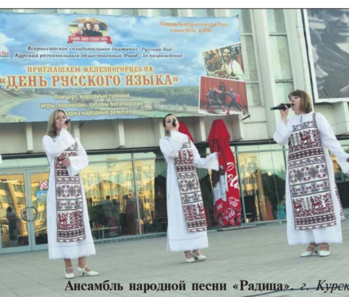
Ансамбль народной песни «Радица» г. Курск