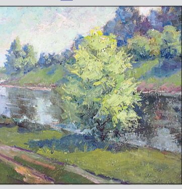
Интересные его пейзажи и натюр-

Темы его сюжетных картин были из русской (советской) истории: «По-