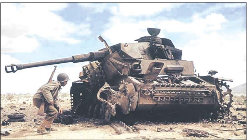
огневую дуэль вести наравных. Но немец-то не будет ждать, значит, 700 метров «тридцатьчетверке» придется идти под его прицельным огнем.