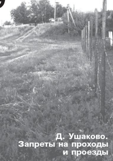
Д. Ушаково. Запреты на проходы и проезды

Современные эксплуатеры прудов так гадят воду, что летом от прудов