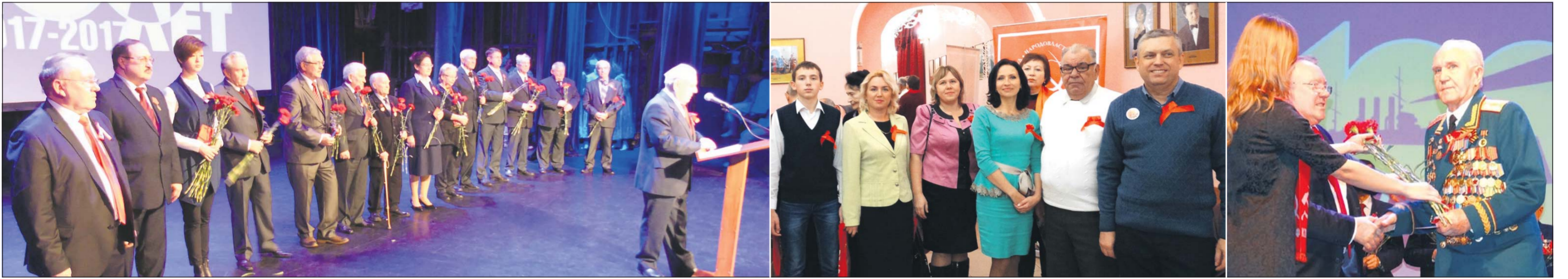
На сцене награжденные медалью «100 лет Великой Октябрьской социалистической революции»

Торжественное собрание, посвящённое 100-летию Великого Октября. Областная филармония. 5 ноября.