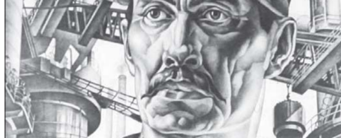
Пролетариат – могильщик капитализма потому, что он занимает ключевое положение в системе общественного производства и органически связан с самыми прогрессивными его формами

В прошлом трудящиеся развитого Запада тоже подвергались беспощадной эксплуатации. Однако, борясь против этого, они сумели добиться, в том числе и за счет влияния русского Октября, более выгодного для них распределения мирового общественного продукта за счет тех, кто еще не готов к эффективному производству. Трудящиеся США и Западной Европы присваивают себе стоимость большую, чем они производят, т.е. उपодобляются частным собственникам, не являясь по факту таковыми. При этом эта дополнительная часть их дохода взята из произведенной стоимости, произведенной трудящимися пролетариатом Азии, Афри-