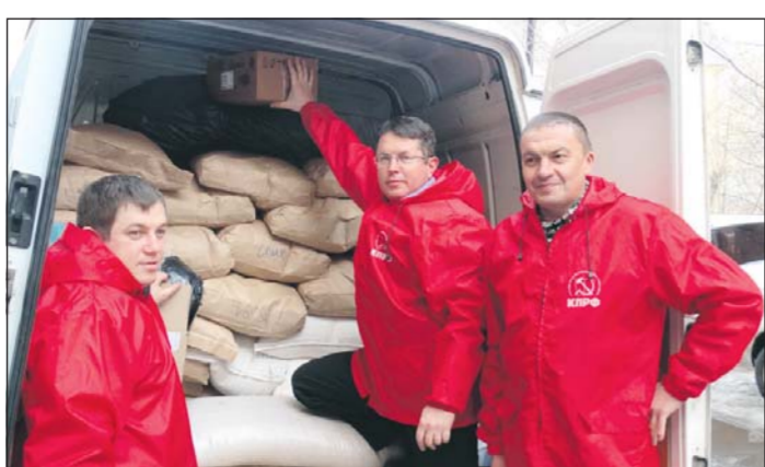
продукты питания длительного срока хранения без морозильных и холодильных камер.

Страшные события в Донцке время от времени продолжаются. Каратели-националисты не унимаются – выполняют программу, заданную Западом. Гуманитарная катастрофа нигде не дева-лась. В городах и поселках перебои с продуктами и водой, с обеспечением медикаментами и предметами первой необходимости.