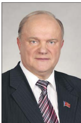
Уважаемые товарищи! Мои друзья!

Поздравляю Вас с Днём Советской Армии и Военно-морского флота! Несокрушимая и легендарная, в боях познавшая радость побед... созданная 99 лет назад под алым стягом Великого Октября, она крепла и мужала вместе с Советской страной. Плоть от плоти народа, Красная Армия впитала в себя лучшие победные традиции Русского воинства. Она хранила верность завету генералиссимуса Суворова: "Побеждает тот, кто меньше себя жалует". Она помнила наказ адмирала Ушакова: "Врагов не считая, их бьют". Самоотверженность и воинское искусство красных полководцев и бойцов вписали многие славные страницы в нашу историю. Они умели сохранять стойкость тогда, когда, казалось, силы человеческие исчерпаны. Они сокрушали противника, прежде считавшегося непобедимым. Ни один агрессор не мог совладать с историей народной армии-защитницы.