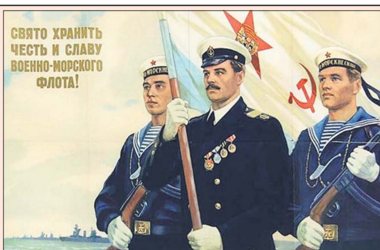
СВЯТО ХРАНИТЬ ЧЕСТЬ И СЛАВУ ВОЕННО-МОРСКОГО ФЛОТА!