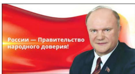
Непрофессиональные действия кабинета министров не способны исправить ситуацию. Вместо обещанных реиндустриализации и импортозамещения продолжают открытое удушение производства. В сельском хозяйстве сокращаются площади посевов и поголовье скота.

Много раз министр "экономических чудес" Улюкаев торжественно объявлял о начале выхода из кризиса. Но его нет и близко! Дефицит бюджета превысил два триллиона рублей. Даже по официальному данным спад в экономике в этом году достигнет 2,5%. Реальные доходы населения упали на 10%. Заморожены зарплаты бюджетников, включая денежное содержание военных. Фактически заморожены и без того крошечные пенсии. Между тем, цены на продукты питания и тарифы ЖКХ растут вверх чуть ли не каждый день. Бурными темпами идет социальное расслоение: 110 семей захватили более трети национального богатства страны, а число нищих, по официальным данным, превышает 20 миллионов человек.