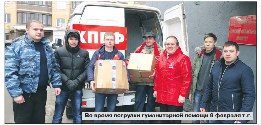
Во время погрузки гуманитарной помощи 9 февраля т.г.