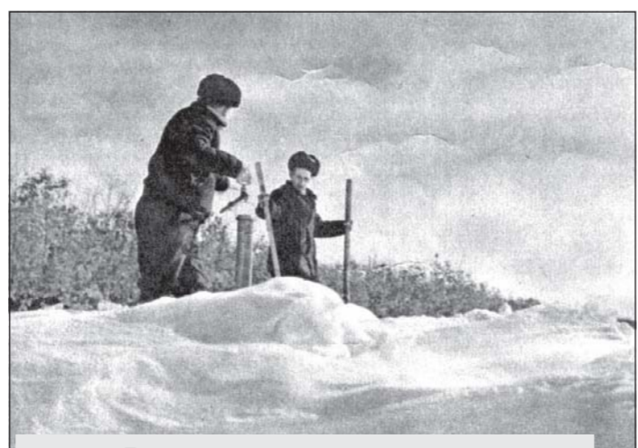
Курск. Фото О.Сизова С картинки из фотоальбома за 1968 год.

стимо! Формально исследования эрозии от стока талых вод в тематическом плане есть. Ливни эпизодически бывают. Однако