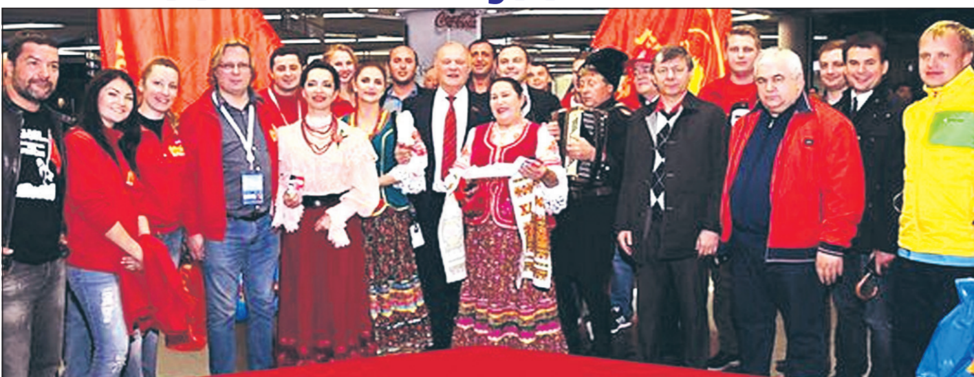
Г.А. Зюганов прибывает в Сочи для участия в работе XIX Всемирного фестиваля молодежи и студентов