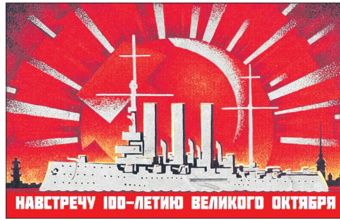
НАВСТРЕЧУ 100-ЛЕТИЮ ВЕЛИКОГО ОКТЯБРЯ

Либо это сделают трудящиеся, которые сломают нынешнюю бюрократическую машину и восстановят подлинную Советскую власть.