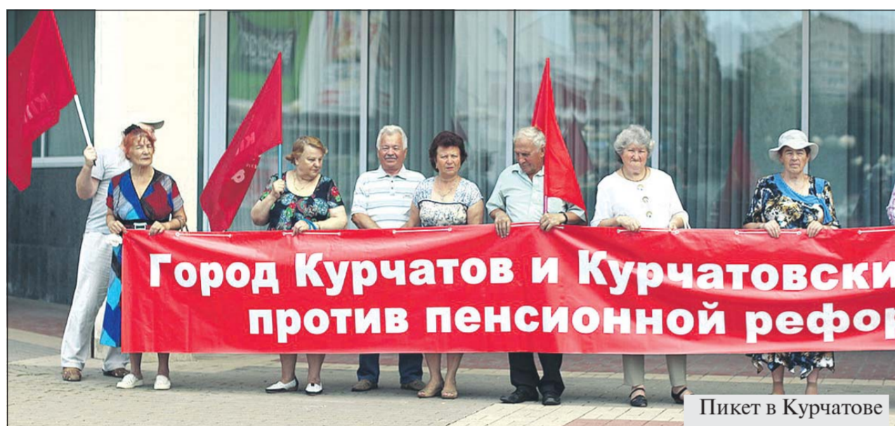
Пикет в Курчатове