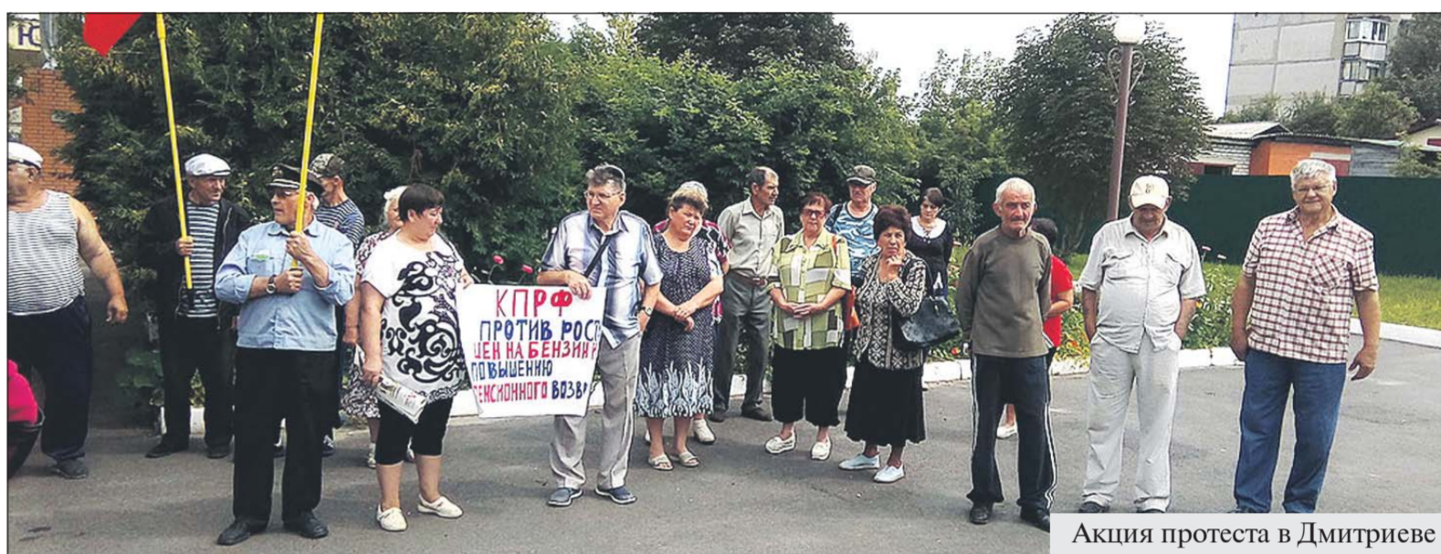
Акция протеста в Дмитриеве