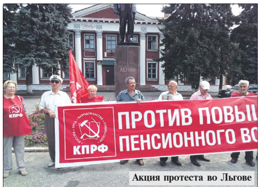
Акция протеста во Льгове