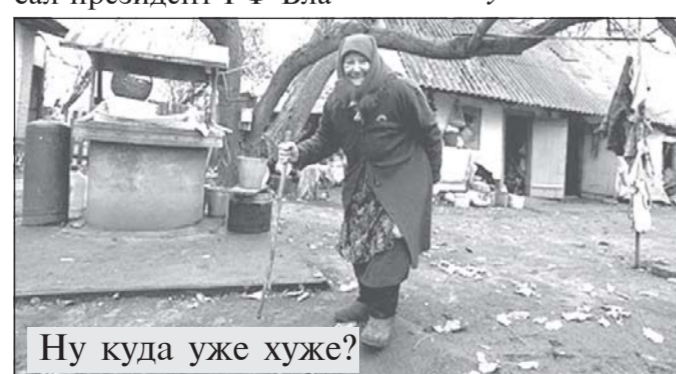
Ну куда уже хуже?

дмир Путин. «МК Черноземье», 8 августа 2018 года