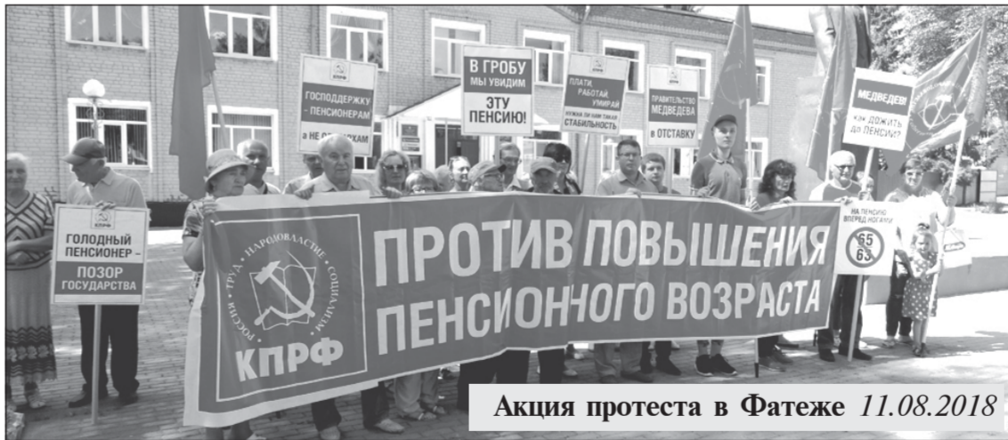
Акция протеста в Фатеже 11.08.2018

Опрос проводился 22-26 июня по репрезентативной всероссийской выборке городского и сельского населения. Были опрошены 1600 человек в возрасте от 18 лет в 136 населенных пунктах 52 субъектов России.