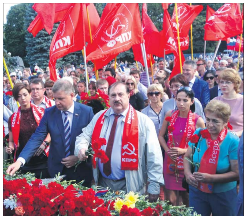
2018 год в Курской области проходит под знаком 75-летия Курской битвы.

Пятьдесят дней, с 5 июля по 23 августа 1943 года, продолжалась Курская битва, включающая Курскую оборонительную (5 - 23 июля), Орловско-Курскую (12 июля - 18 августа) и Белгородско-Харьковскую (3-23 августа) наступательные стратегические операции советских войск. По своему размаху, привлеченным силам и средствам, напряженности, результатам и военно-политическим последствиям она является одной из крупнейших битв Второй мировой войны.