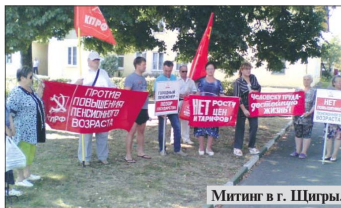
Митинг в г. Щигры.