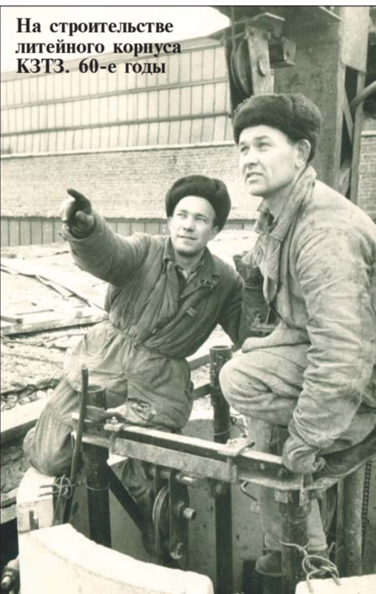
На строительстве литейного корпуса КЗТЗ. 60-е годы

... Время идет: что-то стирается в памяти, что-то остается навсегда. Помню рабочего первого