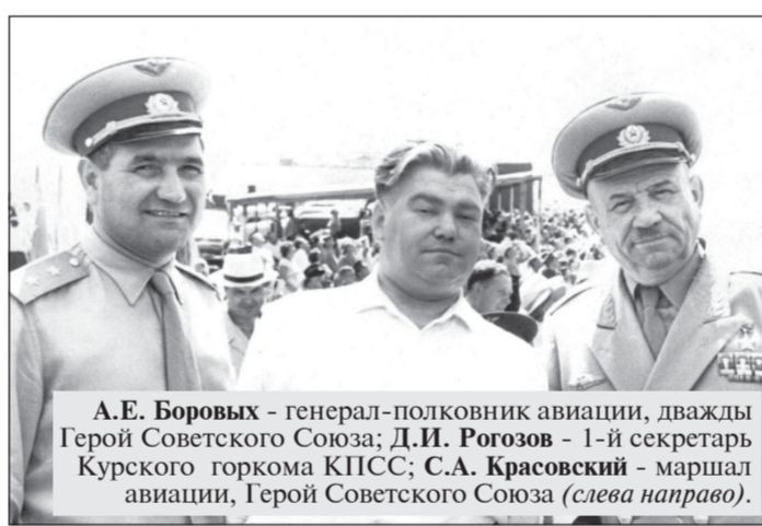
А.Е. Боровых - генерал-полковник авиации, двукратный Герой Советского Союза; Д.И. Рогозов - 1-й секретарь Курского горкома КПСС; С.А. Красовский - маршал авиации, Герой Советского Союза (слева направо).

В 1953 г. избирается первым секретарем Московского райкома КПСС, в 1955-1958 гг. заведующий отделом партийных органов в обкоме партии, в 1958-1959 гг. - секретарь обкома, в 1959-1963 гг. - первый секретарь Курского горкома КПСС.