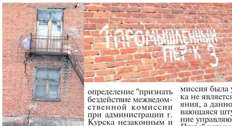
определение "признать бездействие межведомственной комиссии при администрации г. Курска незаконным и обязать ее признать помещения непригодными для проживания, аварийными и подлежащими сносу, рассмотреть заявление государственной жилищной инспекции Курской области от 18.10.2011".

Обескураженные бездействием работников межведомственной комиссии, жильцы обратились в Ленинский районный суд, который вынес решение... в пользу органа местного самоуправления. И только в апреле 2012 года после апелляции Курский областной суд вынес