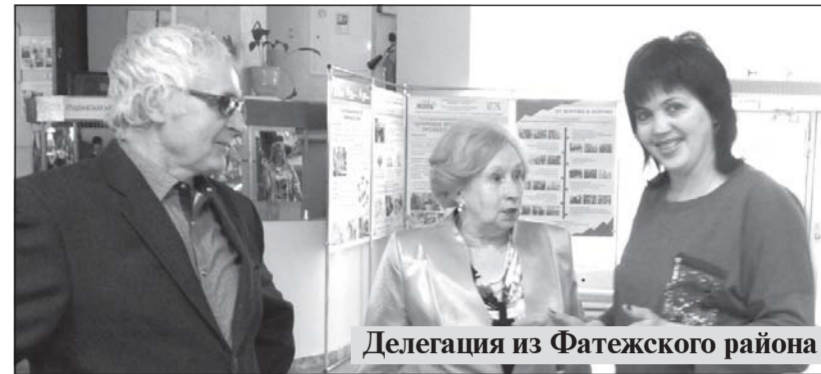
Делегация из Фатежского района