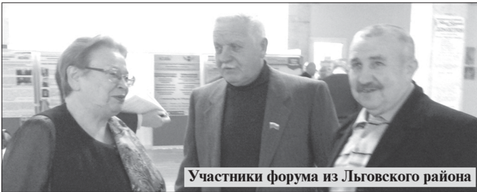
Участники форума из Львовского района