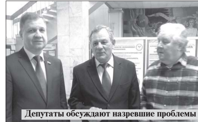
Депутаты обсуждают назревшие проблемы