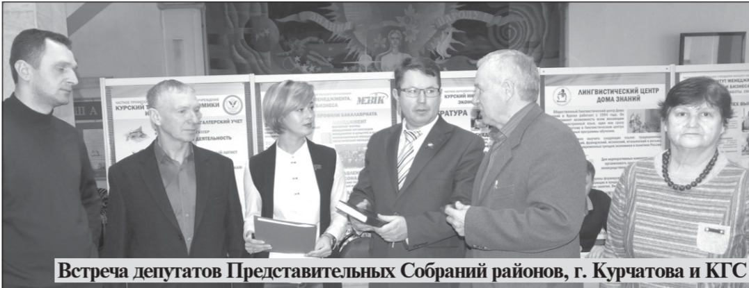
Встреча депутатов Представительных Собраний районов, г. Куратова и КГС

Главное условие успешной, результативной деятельности депутатов-коммунистов, находящихся пока в меньшинстве, - это организованность и дисциплина, четкое взаимодействие депутатов всех уровней друг с другом, с местными партийными комитетами и первичными отделениями КПРФ".