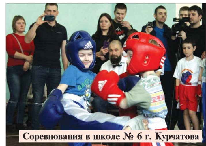
Соревнования в школе № 6 г. Курчатова