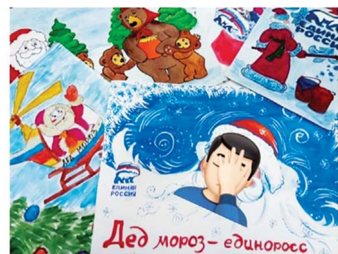
Сбор конкурсных работ продлится до 10 декабря 2019 года

Стартует конкурс детских рисунков «Дед мороз - Единоросс»