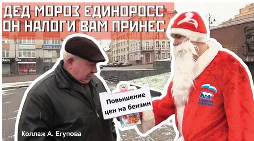
Коллаж А. Егулова

Их акцию поддержали коммунисты и комсомольцы, союзники и сторонники во главе с 1-м секретарём ОК КПРФ, депутатом Госдумы ФС РФ, председателем