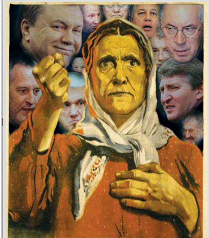
Да когда же вы, наконец, нажрётесь!