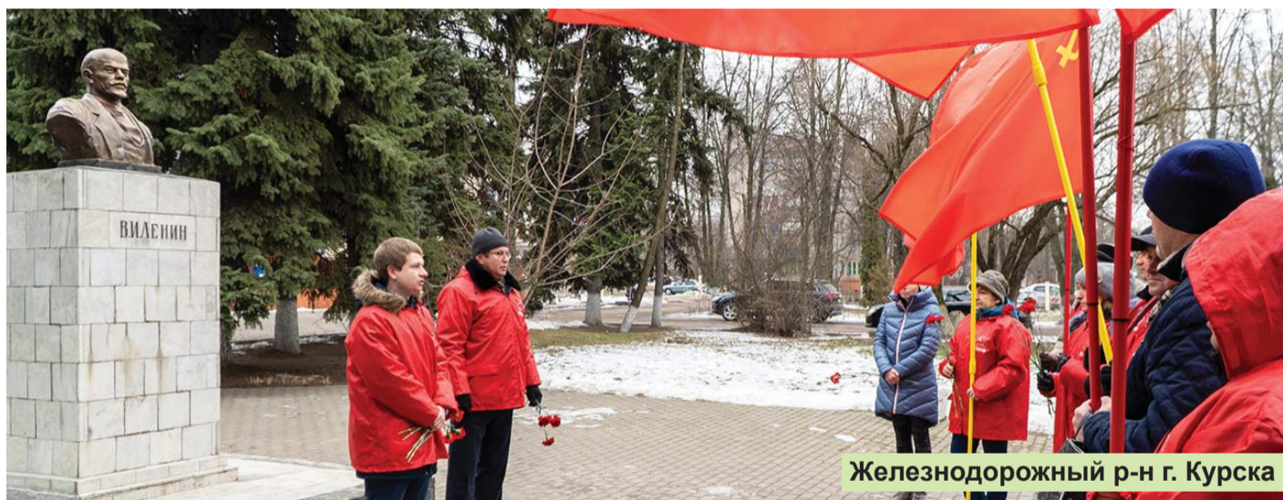
Железнодорожный р-н г. Курска

21 января — День памяти вождя мирового пролетариата и основателя Советского государства Владимира Ильича Ленина. На Красной площади Курска состоялось традиционное возложение цветов к памятнику В.И. Ленину. Куряне сюда приходят ежегодно.