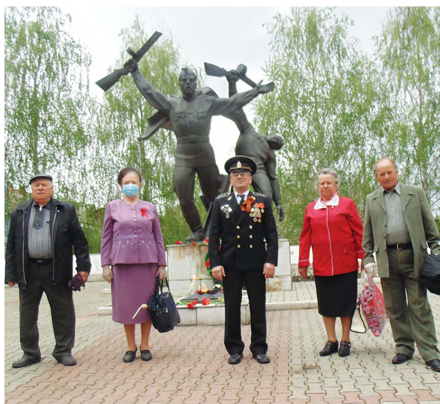
День Победы в Щигровском районе